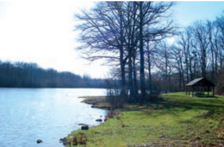
Etang de Villefermoy

B Au bout du chemin, tourner à droite puis immédiatement à gauche. Le chemin descend à travers bois. En bas, longer le ru vers la droite. Continuer sur le chemin. 250 mètres plus loin, derrière la ferme, emprunter le chemin qui longe l'étang à votre gauche et le suivre jusqu'au bout. Au grand carrefour, continuer sur la route du Petit étang, la deuxième vers la droite. Au carrefour de la Meunière, prendre à gauche la route du ru Guérin et retourner au parking.