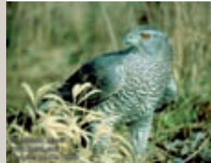
Autour des palombes

Zone de Protection Spéciale (ZPS) depuis 2005