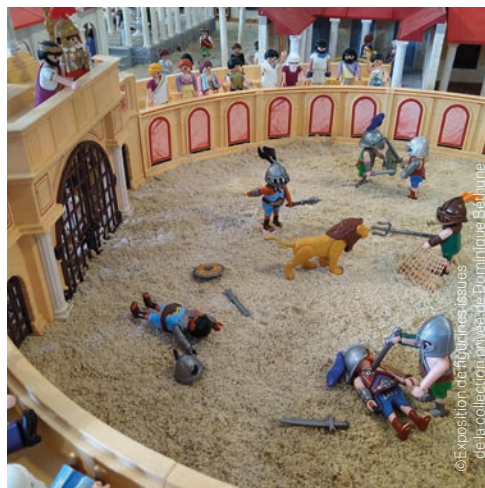
© Exposition de figurines issues de la collection privée de Dominique Béthune

Organisateurs : la Brie Nangissienne / La Riobé / Agrippa