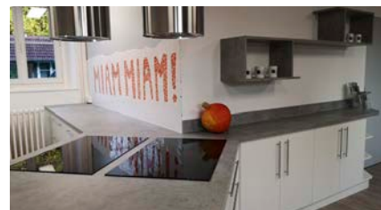
FONTENAILLES 95 rue Maurice Wanlin